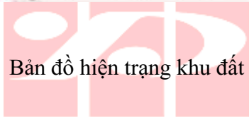
Bản đồ hiện trạng khu đất