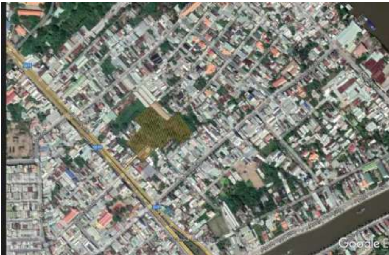
Vị trí khu đất trên google map